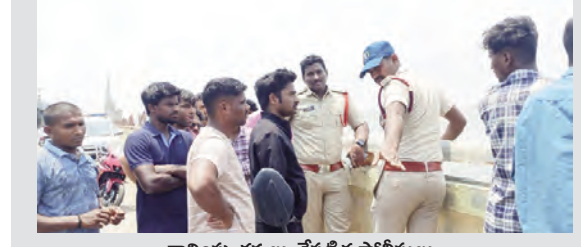
గాలింపు చర్యలు చేపట్టిన పోలీసులు