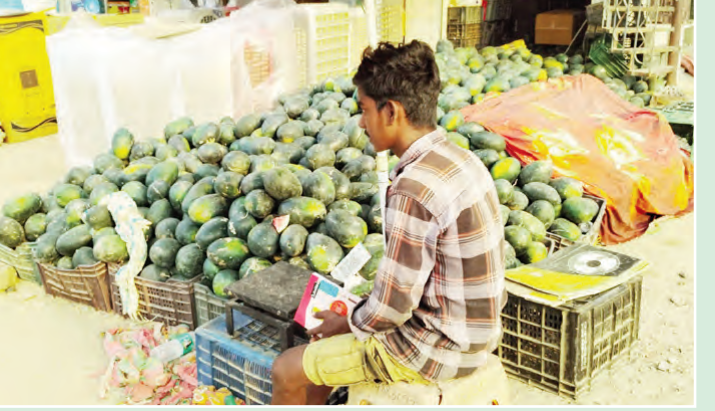
ఎండలోనే వ్యాపారం కొనసాగిస్తున్న చిరు వ్యాపారులు

చూపిస్తున్నారు. రోడ్లపై చిరు వ్యాపారులు ఎండలో కూర్చోని వ్యాపారం చేసుకునే దృశ్యాలు కనిపిస్తున్నాయి ఎండ తీవ్రత నుండి రక్షించుకోవడానికి నీళ్లు ఎక్కువగా తాగాలని డాక్టర్లు సలహాలు ఇస్తున్నారు. ఉదయం 11 గంటలకు ఎండ తీవ్రత మొదలై సాయంత్రం ఐదు దాటిన ఉష్ణోగ్రత ప్రభావం మూపుతుంది. మధ్యాహ్నం సమయంలో రోడ్లపై జనాలు తిరగడం తక్కువగా కనిపిస్తుంది. చిన్న పిల్లలను ఎండవండ తీవ్రత కారణంగా బయటకు తీసుకురావద్దని సూచిస్తున్నారు. రోడ్లకు ఇరువక్కల ఉన్న చిరు వ్యాపారులు ఎండ తీవ్రత నుండి తప్పకోవడానికి నానా జబ్బులను పడుతున్నామని వారు వాపోయారు. ఇప్పటికైనా చిరు వ్యాపారులకు దుకాణ సముదాయం ప్రభుత్వం ఏర్పాటు చేసి ఆదుకోవాలని కోరుతున్నారు.