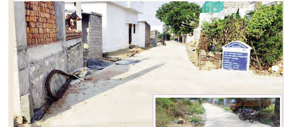
సీసీ రోడ్లకు క్యూరింగ్ చేయని దృశ్యం

-పర్యవేక్షణ లోపమే గుత్తేదారుల నిర్లక్ష్యం