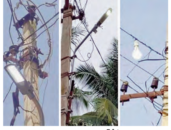
పట్టపగలు వెలుగుతున్న విద్యుత్ దీపాలు

నవాబుపేట, ఏప్రిల్ 12 ప్రభాతవార్త: మండల వ్యాప్తంగా గ్రామ పంచాయతీ కార్యదర్శులు సర్దుచుల విద్యుత్ అధికారుల నిర్లక్ష్య కారణంగా పట్టపగలే వీధి దీపాలు వెలుగుతూ వారి నిర్లక్ష్యాన్ని ఎత్తి చూపుతున్నాయి. దీంతో విలువైన విద్యుత్ వృథా అవుతుందన్న విమర్శలు వెల్లువెత్తుతున్నాయి. పత్తికల్లో పట్టపగలే వెలుగుతున్న వీధిలైట్లు అని పత్తికల్లో వచ్చిన నిమగ్న నీరెత్తినట్టుగా ఆదమ్మి ని ప్రభుత్వంలో ఉన్నట్లు మండల విద్యుత్ అధికారులు వీధిదీపాల నిర్లక్ష్యం ఉన్న సమస్యలను విద్యుత్ సిబ్బంది, కార్యదర్శులు పట్టించుకోవడం లేదని పలువురు విమర్శిస్తున్నారు. మండలంలోని చాలా గ్రామాల్లో వీధి దీపాలు నిరంతరం వెలుగుతూనే ఉన్నాయి. వగలు, రాత్రి తేడా లేకుండా వెలుగుతుండడంతో వందలాది యూనిట్లు విద్యుత్ వృథా అవుతున్నది. ఫలితంగా విద్యుత్ శాఖ, గ్రామ పంచాయతీలు తీవ్రంగా నష్టపోతున్నాయి. ప్రత్యేక లైన్లు విద్యుత్ వైర్ల లేక, ఆన్ ఆఫ్ స్వీచిలు ఏర్పాటు చేస్తేనే ఈ సమస్యకు పరిష్కారం అవుతుంది. ప్రభుత్వం నిరంతరం విద్యుత్ ను అందించడానికి వేలకోట్ల వెచ్చిస్తున్నా విద్యుత్ ను సంబంధిత అధికారులే నిర్లక్ష్యంగా వ్యవహరిస్తున్నారు. ప్రత్యేక అధికారి పర్యవేక్షణ లోపంతో పంచాయతీ ఆధారానికి గండి వడుతుంది. జనాభా మేరకు విద్యుత్ దీపాలు ఏర్పాటు చేయాలి రాత్రి పూట ఆన్ చేసి ఉదయం పూట ఆఫ్