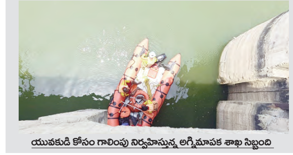
యువకుడి కోసం గాలింపు చర్యలు చేపట్టిన అగ్నిమాపక శాఖ సిబ్బంది